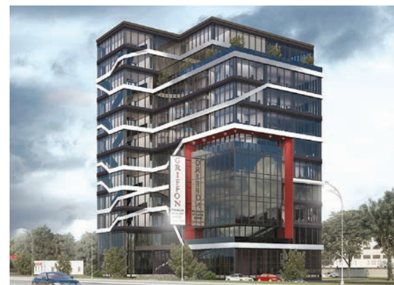
Спеціальний приз від ПКП «Паритет-К» за успішну ідею бізнес-центру – команда A15, КНУБА