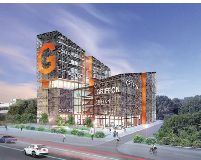
1 місце у категорії «Бізнес-центр» і відзнака компанії «Сталекс» – М36 (Аліна Головатюк, КНУБА)