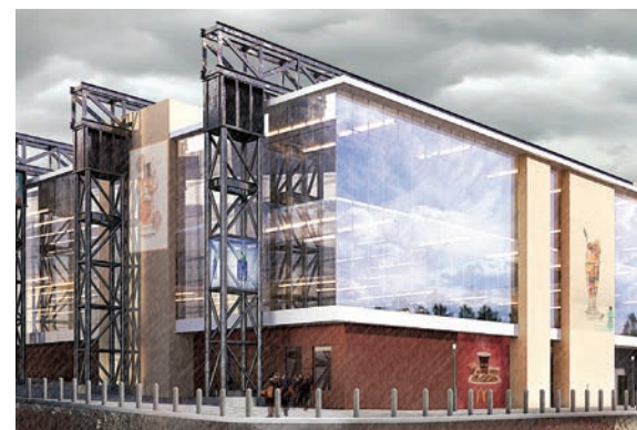
«Приз глядацьких симпатій» у категорії «Торговий центр» – команда S27, ХНУБА