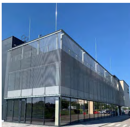
Автосалон «Aston Martin» с.Гора, Киевская обл.

Благодаря своей прочности, долговечности, коррозионной стойкости, эффектому внешнему виду, этот вид архитектурной сетки позволяет реализовать оригинальные и современные дизайнерские решения в стиле luxury .